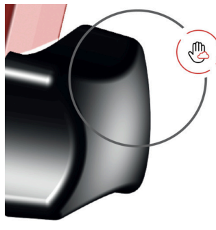
extra reduced radius spin