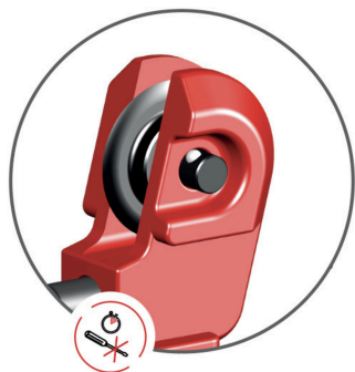
instant wheel change