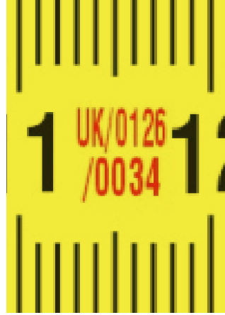
Avrupa tipi onay sertifikası