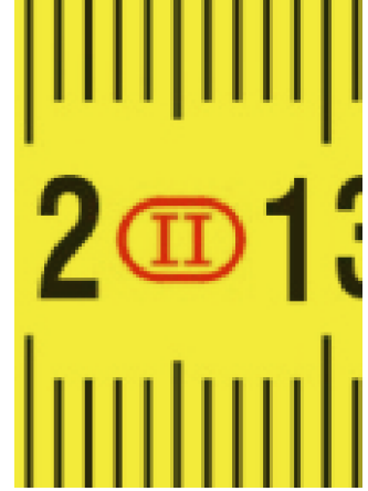
Preciseness to class II