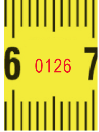
Onaylanmış kuruluş no.