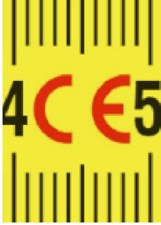
Uyumlaştırılmış standartlara uygun olarak üretilmiştir