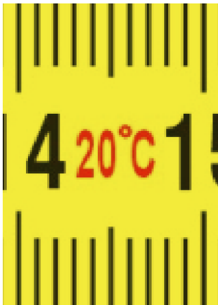
Çalışma sıcaklığı durumu