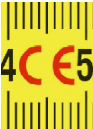
Proizvedeno u skladu sa usaglašenim standardima