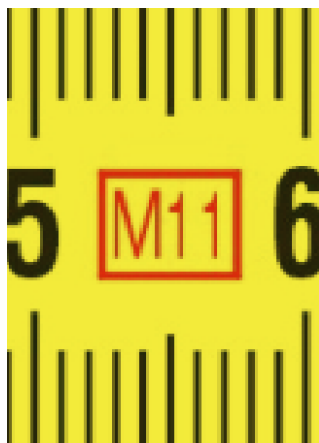
An de fabricatie