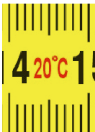
Temperatură de lucru