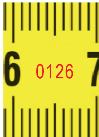
Odniesiony numer korpusu.