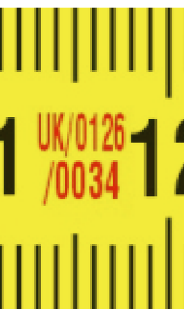
Európai típusú megfelelőségi tanúsítvány