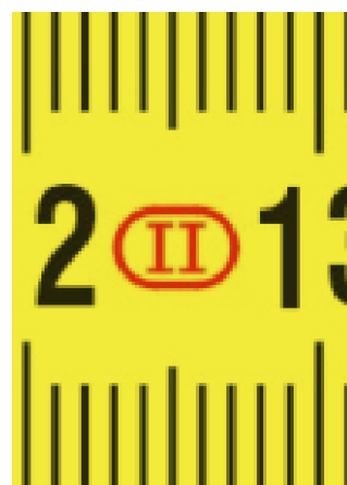
Precisenness to class II