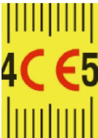
Izrađeno u skladu s harmoniziranim standardima