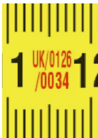
Potvrzení evropského certifikátu