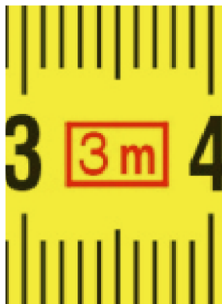
Дължина на лентата