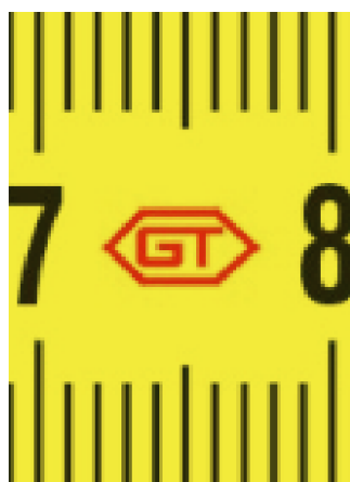
Абревиатура на производителя