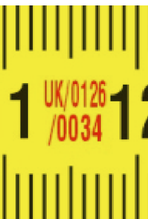
Европейски сертификат за типово одобрение