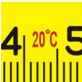
Uslovi radne sredine - radna temperatura