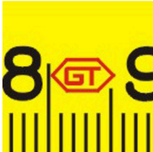
Abbreviations for manufacturer