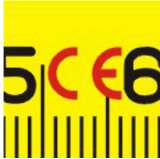
Izrađeno u skladu s harmoniziranim standardima