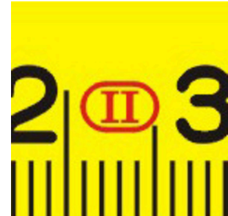
Precisenness to class II